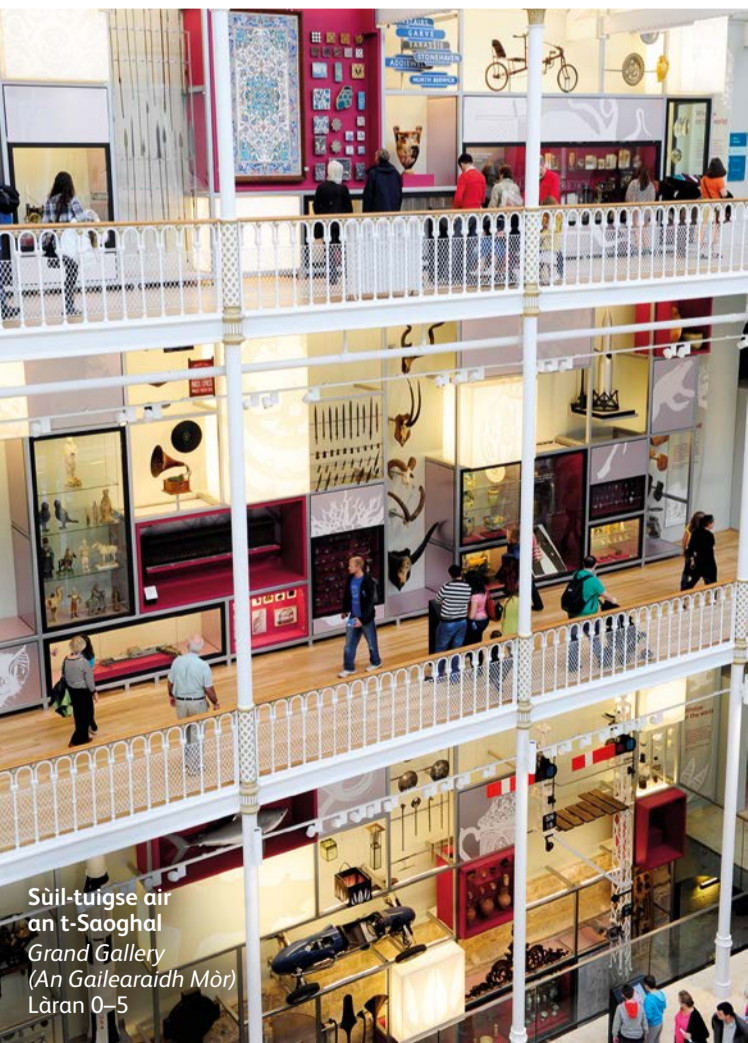
Sùil-tuigse air an t-Saoghal Grand Gallery (An Gailearaidh Mòr) Làran 0-5